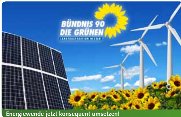
Energiewende jetzt konsequent umsetzen!

Erneuerbare Energien wurden in den letzten zwölf Jahren in Hessen stiefmütterlich behandelt. Während andere Bundesländer die Energiewende einleiteten, setzte die schwarz-gelbe Landesregierung allein auf das Atomkraftwerk in Biblis. Das ist jetzt endlich abgeschaltet. Durch die Blockade der Energiewende durch Schwarz-Gelb ist Hessen jetzt zu dem Bundesland geworden, das den größten Anteil des Stromverbrauchs aus anderen Bundesländern importieren muss. Aus seiner Ratlosigkeit versuchte Ministerpräsident Bouffier eine Tugend zu machen und berief einen Energiegipfel ein, dem Regierung, Opposition, Kommunen, Umweltverbände, Energieversorger, Wirtschaft und Gewerkschaften