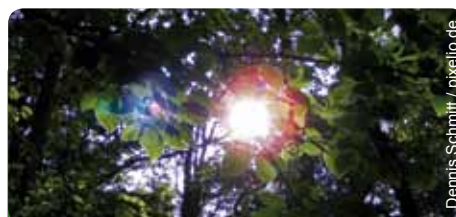
Die Idylle der hessischen Wälder ist in Gefahr

Es ist das gleiche Spiel jedes Jahr: Der Waldschadensbericht wird vorgestellt, was aber fehlt, ist die Vorstellung wirksamer Maßnahmen gegen diese drohende ökologische Katastrophe. Die