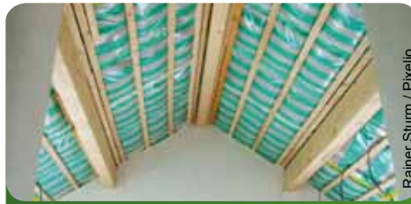
Wärmedämmung ist ein wichtiger Faktor

Die Umsetzung unserer Vorschläge würde nicht nur einen Beitrag zum Klimaschutz leisten, sondern ist für die energetische Modernisierung Hessens genauso wichtig wie als Investitionsprogramm für das hessische Handwerk. Wärmeenergie, die sich von Heizungswärme für Haushalte bis zur Prozesswärme für die Industrie erstreckt, ist für ca. 45 Prozent der CO 2 -Emissionen in Hessen verantwortlich. Ein durchschnittlicher Haushalt verbraucht mit 85 Prozent den größten Teil der Energie für Wärme. Diese Zahlen zeigen, wie wichtig Einsparungen in