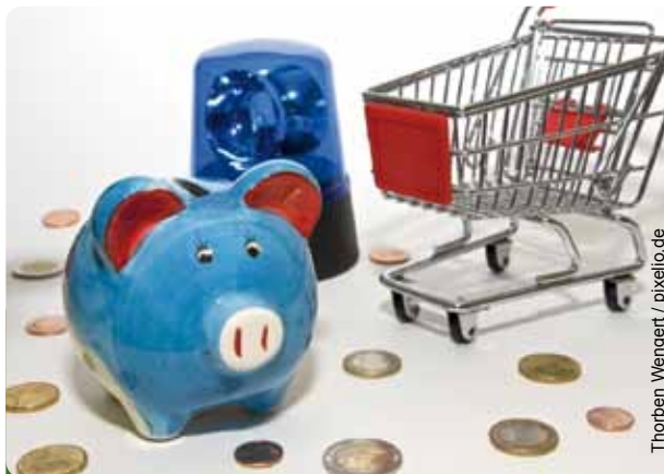
Die Macht der Verbraucher ist nicht zu unterschätzen

Einsatz von RFID im Einzelhandel muss es eine verbindliche Kennzeichnung, Information und Deaktivierungsmöglichkeiten der Chips geben.