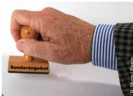
Sonderangebote waren es wohl nicht gerade