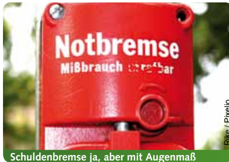
Schuldenbremse ja, aber mit Augenmaß

der Linken alle Fraktionen beteiligt haben, sind wir zu einem gemeinsamen Ergebnis gekommen, mit dem wir sehr zufrieden sein können: Sie ist ein wichtigen Schritt hin zu einer Haushaltskonsolidierung, die soziale und ökologische Aspekte beachtet. Unsere zentralen Forderungen wurden in den Verhandlungen erfüllt: