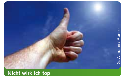
Nicht wirklich top

Einzig die neue Spitze des Finanzministeriums erweckt den Eindruck eines gewissen Neuanfangs. Wir hoffen, dass die neue Staatssekretärin ihre Kenntnisse, die sie offensichtlich in Steuervermeidungsstrategien hat, jetzt im Interesse des Landes einsetzt, um die katastro-