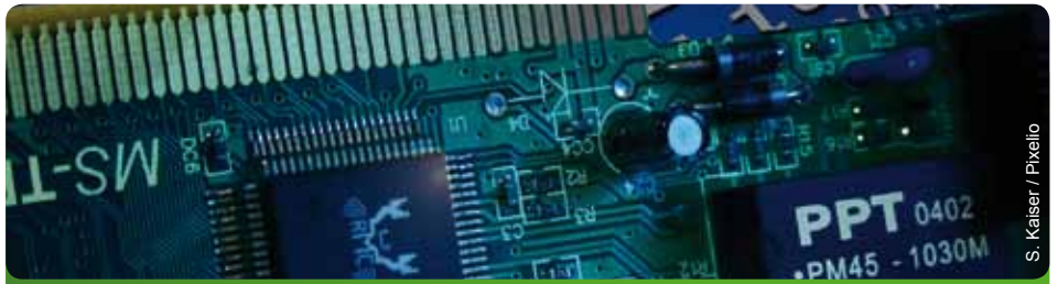
Nicht nur im Bereich Technik werden Fachkräfte immer knapper

In Hessen gibt es laut dem Statistischen Landesamt 100 000 Menschen zwischen 20 und 65 Jahren ohne Abschluss. Hier fordern wir eine Verbesserung der Rahmenbedingungen für lebenslanges Lernen. Besonders auf die Weiterbildung während des Arbeitens muss gesteigerten Wert gelegt werden. Einen besonderen Schwerpunkt möchten wir auf die intensive Verbesserung