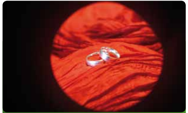
Ehe und Lebenspartnerschaft gleichen sich in vielem

Die eingetragene Lebenspartnerschaft ist eine auf Liebe gegründete und grundsätzlich auf Dauer angelegte Lebens-, Beistands- und Schicksalsgemeinschaft, eben wie die Ehe auch. In beiden Fällen werden die gleichen Pflichten begründet und es ist aus unserer Sicht nur konsequent, dann auch die gleichen Rechte einzuräumen.