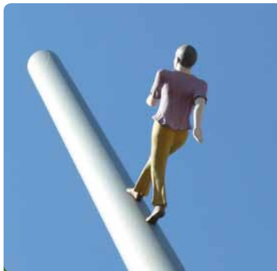
Der Himmelsstürmer braucht in Kassel keinen neuen Flughafen, sonst auch keiner

Es war schon vorher klar und wird jetzt um so deutlicher, die Finanzplanung ist und bleibt unseriös. Je nach Wetterlage werden entweder die gestiegenen Sicherheitsauflagen oder die bösen Neu-