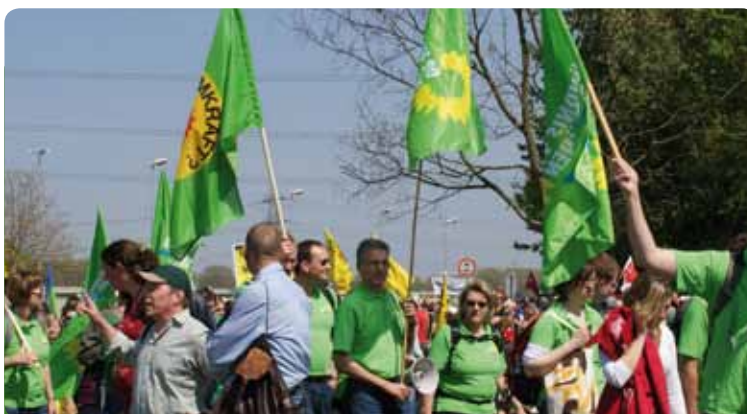
Bei der Demonstration in Biblis waren unter über 10.000 Menschen viele GRÜNE. Bundesweit setzten ca. 150.000 Menschen ein deutliches Zeichen

In Biblis fand damit die größte Demonstration seit mehr als 20 Jahren statt. Es war ein fröhlicher, bunter aber ein in der Sache entschlossener Protest, der sagte: