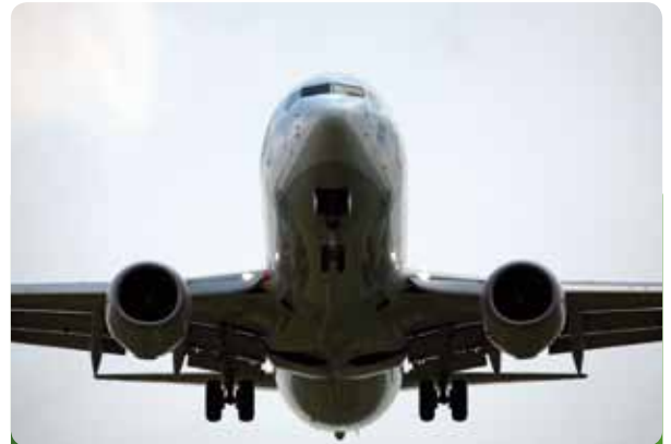
Fluglärm hat Auswirkungen auf die Gesundheit.

Bei der Arbeit der Enquetekommission geht es um eine ebenso kritische wie