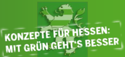
Tarek Al-Wazir - Fraktionsvorsitzender

Unsere Maxime lautet deshalb: Konzepte für Hessen – Mit Grün geht's besser!