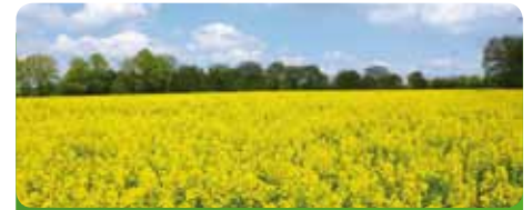
Blühende Landschaften in Hessen - das liegt nicht an CDU und FDP

In den nächsten Wochen werden wir uns verstärkt der Herausforderung stellen müssen, wie Hessen aus der Schuldenfalle herauskommt. Als bisher erste und einzige Fraktion im Landtag haben wir ein solches Konzept vorgelegt. Zur Bewältigung der Herausforderung, die Schulden zu verringern, in einigen Bereichen aber auch zusätzliches Geld be-