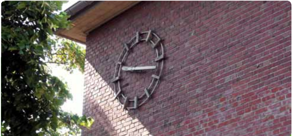
Die Zeit ist reif: Mit dem Konzept „Neue Schule“ von den bei Pisa erfolgreichen Ländern lernen

In den „Neuen Schulen“ lernen Schülerinnen und Schüler in der Regel gemeinsam bis Klasse 9 bzw. 10.