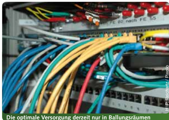
Die optimale Versorgung derzeit nur in Ballungsräumen

www.gruene-hessen.de - Themen - Landesentwicklung