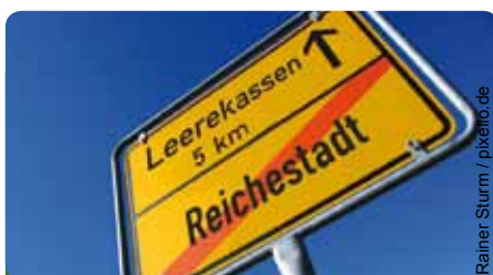
Die finanzielle Lage ist dramatisch

Weitere Kostenbelastungen kommen auf die Kommunen zu: Ab 2013 die Ko-