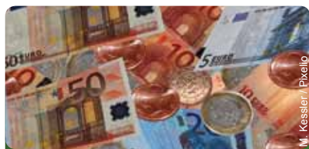
Länder sollen eigene Spielräume schaffen

Es sieht vor, dass sich alle Länder künftig eigene finanzielle Spielräume erwirtschaften. Darüber hinaus soll nur dort solidarische Unterstützung geleistet werden, wo dies auf Grund von strukturellen Unterschieden zwischen den Bundesländern nötig bleibt. Nur dort,