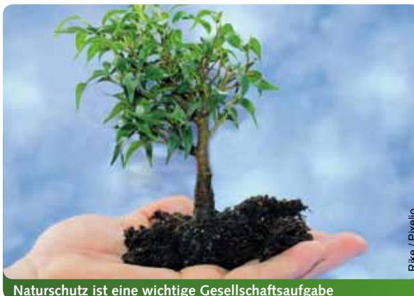
Naturschutz ist eine wichtige Gesellschaftsaufgabe

Es müssen wieder große Landschaftsschutzgebiete geschaffen, die Anzahl der gesetzlich geschützten Biotope muss erhöht und die Beschneidung der Mitwirkungsrechte der Naturschutzverbände muss rückgängig gemacht werden. Wir setzen uns auch dafür ein,