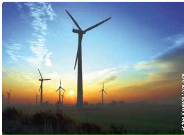
Windenergie wird auch in Hessen eine wichtige Rolle spielen

zes Vorreiter. Bereits 2007 gab es in Hessen GRÜNE Konzepte, die der Frage nachgingen, in welchem Zeitraum eine