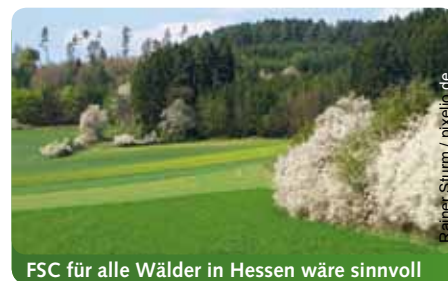
FSC für alle Wälder in Hessen wäre sinnvoll

Der Naturverjüngung steht jedoch entgegen, dass es zu viel Wild im Wald gibt. Wir Grüne setzen uns deshalb dafür ein, dass die hohen Wildbestände durch effektivere Bejagung und durch ein Verbot der Wildfütterung so reduziert werden, dass eine natürliche Verjüngung des Waldes wieder möglich wird.