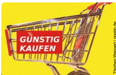
Auch Verbraucher haben Verantwortung

es in Hessen möglichst viele Betriebe und eine flächendeckende Landwirtschaft zu erhalten. Wir wollen den ökologischen Landbau, der für uns das Leitbild einer zukunftsfähigen Landwirtschaft ist, bis zum Jahre 2020 um zehn auf zwanzig Prozent ausdehnen und Hessens Landwirtschaft weiterhin gentechnikfrei